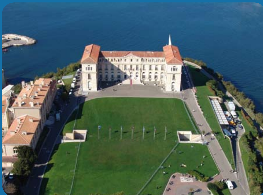
PALAIS DU PHARO 58, boulevard Charles Livon 13007 Marseille

Agence pour l'Éducation par le Sport - 47, rue Marx Dormoy 75018 Paris Tél. : +33 (0) 1 44 54 94 94 / Fax : +33 (0) 1 44 54 94 95 - www.apels.org