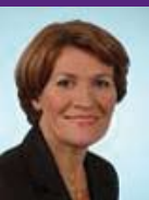
Claude GREFF , Vice-Présidente déléguée de l'APELS, Députée d'Indre et Loire, Membre de l'Assemblée parlementaire du Conseil de l'Europe